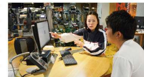
■ボディチェックの診断とカウンセリング

ご入会当初は不安を解消できるように、また目的を達成できるようにしっかりとサポートさせていただきます。長く在籍していると目的やご利用内容が変化するときもあります。その時にも個人に合ったメニューをご提案いたします。これがピノスのメンバーズサポートシステムです。