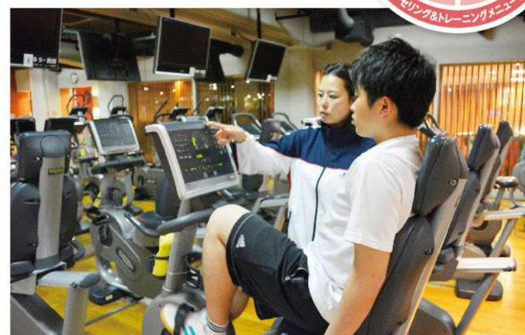
■あなた専用のトレーニングメニューで運動